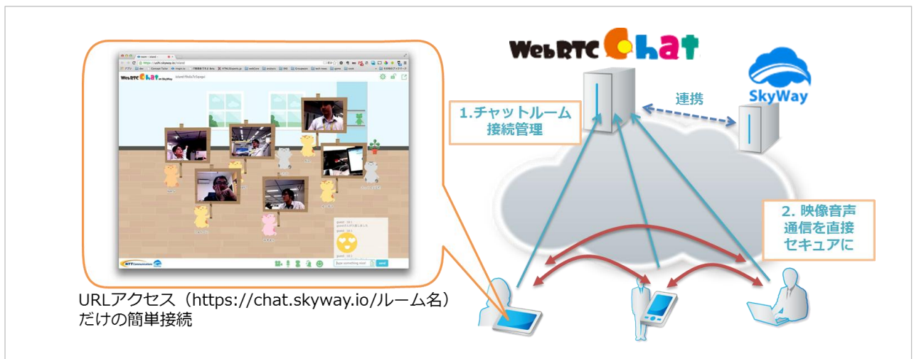
<図 1: WebRTC chat on SkyWay の仕組み>

WebRTC サービスを提供していく際に今後必要となる、サーバーシステムの冗長化や柔軟な拡張方法など、信頼性の高いシステムの実現方式を明らかにしていくため、「WebRTC Chat on SkyWay」の提供を通して得られた知見を「SkyWay」*3 へ反映し、可用性の高い WebRTC プラットフォーム機能を順次追加していきます。